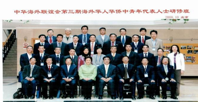
中华海外联谊会理事和中华文化学院院长与研修班学员合影